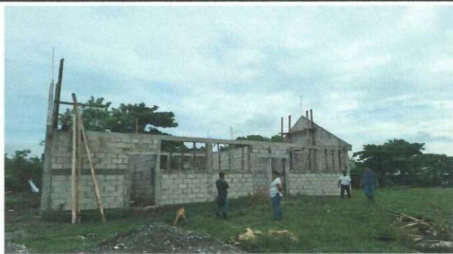
Foto 3: CUBRIMIENTO EN SU TOTALIDAD CON ESTRUCTURA DE TECHO Y CUBIERTA DE LAMINA