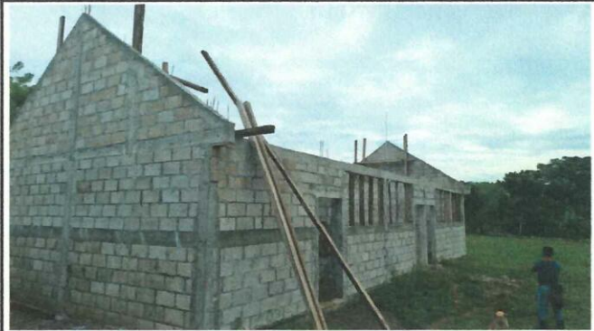
Foto 2: ELEBORACION DE TIJERAS PARA SOPORTE DE CUBIERTA DE LAMINA